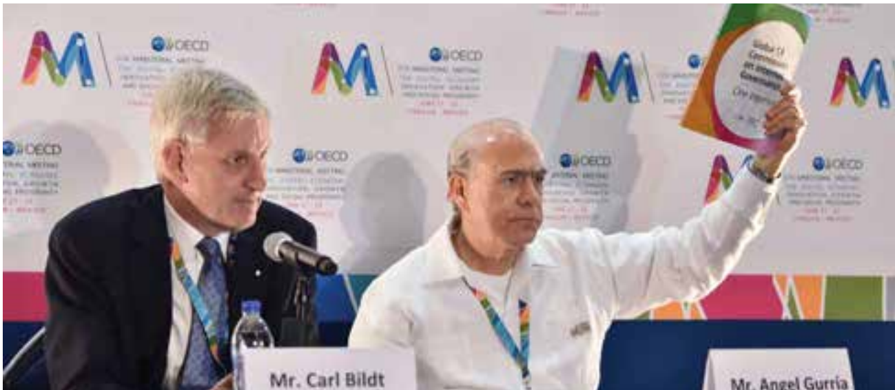
Angel Gurría, secrétaire général de l'Organisation de coopération et de développement économiques (OCDE), présente One Internet , le rapport final de la Commission mondiale sur la gouvernance d'Internet (CMGI), née d'un projet conjoint du CIGI et de Chatham House, aux côtés du directeur de la CMGI Carl Bildt, à l'occasion de la Réunion ministérielle de l'OCDE tenue le 21 juin 2016 à Cancun, au Mexique. Les recommandations du rapport portent sur les droits et responsabilités de tous les acteurs qui contribueront à l'application des quatre aspects fondamentaux d'un Internet à la fois sain et robuste : ouverture, sécurité, fiabilité et inclusion.

Le programme Sécurité et politique internationales traite d'une série d'enjeux en matière de sécurité, de gestion des conflits et de gouvernance. Plus que jamais, la transformation accélérée du contexte de sécurité planétaire nécessite de produire une recherche de premier ordre et de mobiliser au plus haut niveau les milieux nationaux et internationaux d'élaboration des politiques et de recherche appliquée. Cette année encore, l'équipe du programme a renforcé ses partenariats et multiplié les initiatives pour diffuser efficacement ses travaux et créer des forums internationaux de discussion sur les grands sujets de l'heure.