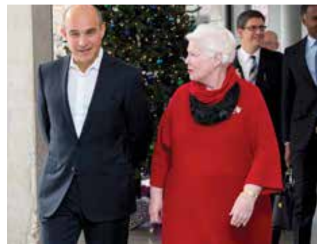
M me Elizabeth Dowdeswell, 29 e gouverneur général de l'Ontario, ici en compagnie de Jim Balsillie, président de notre conseil d'administration, a rendu visite au CIGI à l'occasion d'une table ronde privée tenue en décembre 2015.