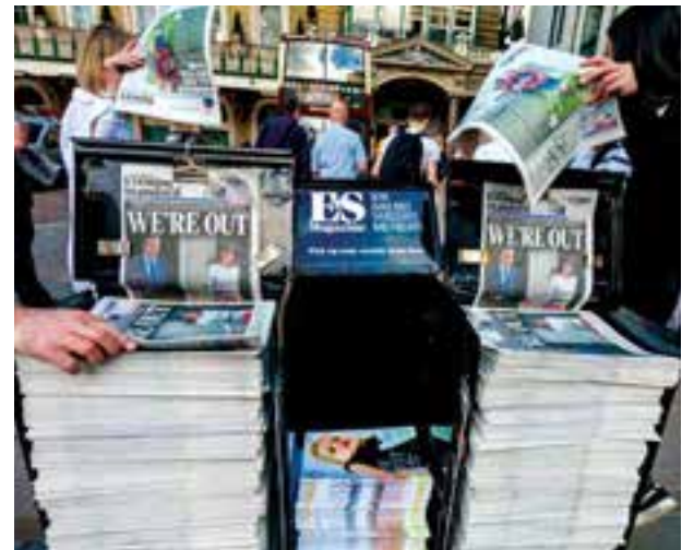
Nombre d'experts du CIGI font autorité sur les questions de politique internationale. Les chercheurs de nos trois programmes ont produit analyses et commentaires sur plusieurs événements clés et grands sujets d'actualité, comme le Brexit de juin 2016.