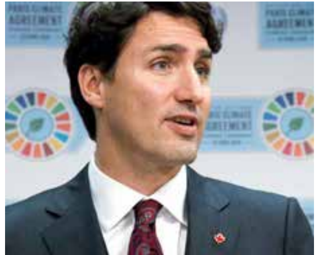
Le premier ministre du Canada Justin Trudeau, le 22 avril 2016, lors de la signature historique de l'Accord de Paris conclu à la 21 e Conférence des Parties (COP21), où des experts des trois programmes du CIGI ont participé à de nombreuses activités.

Le CIGI croit qu'une meilleure gouvernance internationale peut améliorer la vie des populations en favorisant la prospérité, la viabilité environnementale, la réduction des inégalités, la protection des droits de l'homme et la sécurité mondiale.