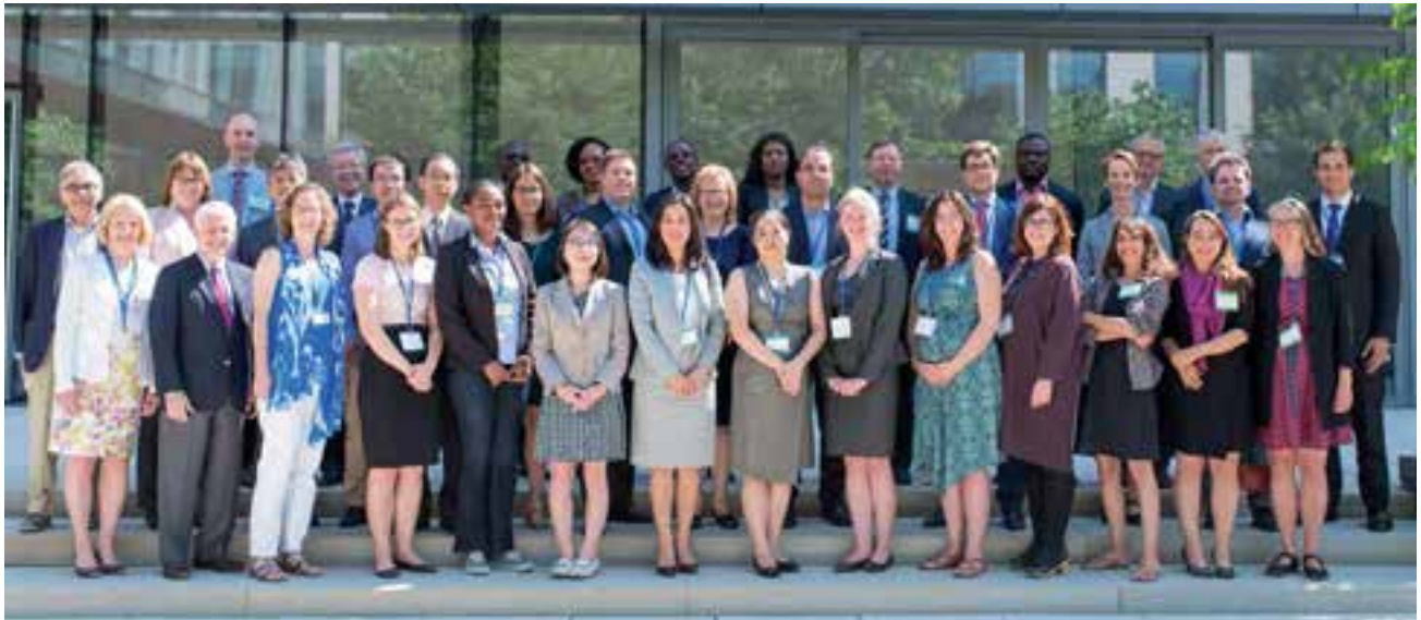
Les participants de la Sixth International Four Societies Conference, tenue en juillet 2016 sur le thème de l'innovation et de l'environnement par le PRDI du CIGI et le Conseil canadien de droit international, rassemblés dans la cour du Campus du CIGI.