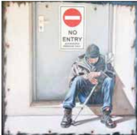
« No Entry », Kerry Ross