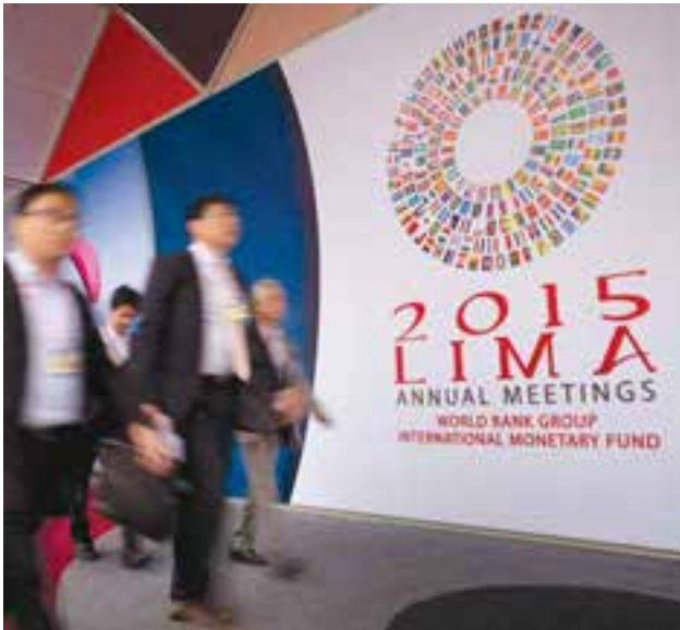
Arrivée de délégués aux Assemblées annuelles du FMI et du Groupe de la Banque mondiale tenues à Lima, au Pérou, en octobre 2015, auxquelles des représentants du CIGI ont collaboré à titre de participants, d'experts et de présentateurs.